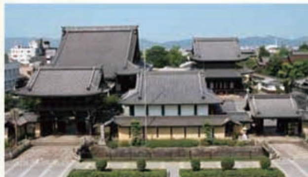
真宗興正派本山興正寺全景